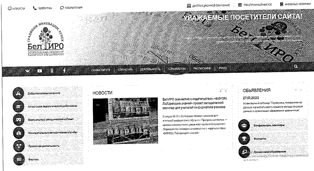
Рис. 1. Раздел «Слушателям»